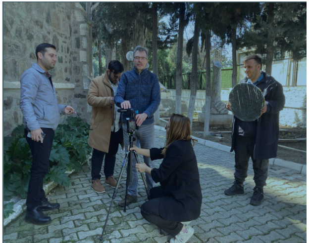
Fotograafiaalane õppepäev Buca koguduses